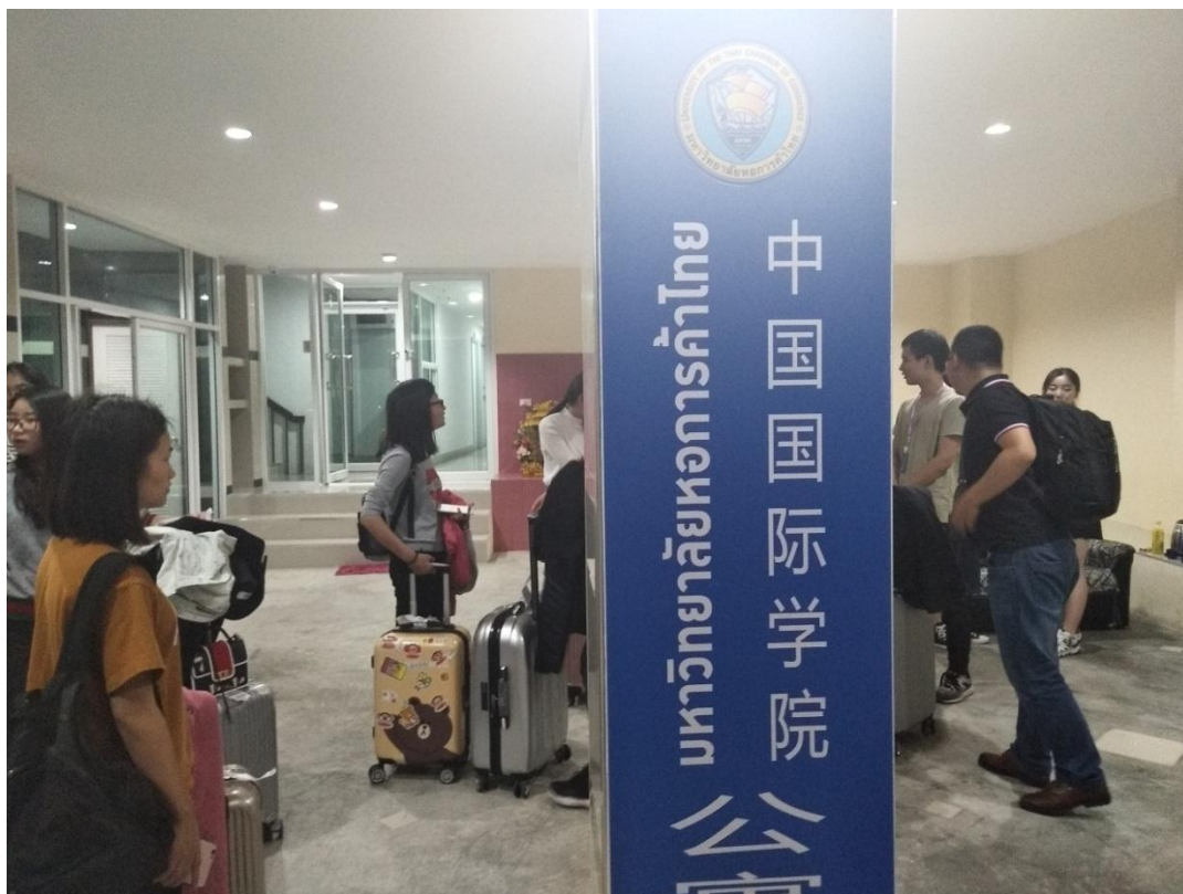
图为：学生公寓楼下

首先是学习上的经历，抵达泰国的第二天我们就参加了开幕仪式，泰国商会大学邀请到了山东商会在泰的会长给我们分享他自己的职业经验以及四川大学的教授给我们讲了职业层次的重要性。可以说是受益匪浅，从他们的 ppt 中我总结，成功的人，在言语上都是简洁而中肯的。